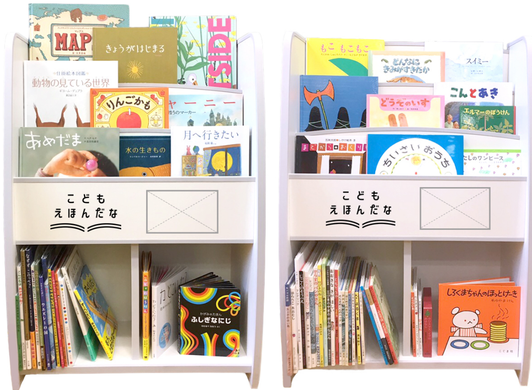
(左) インスパイア (Inspire) 棚イメージ (右) 傑作 (Masterpiece) 棚イメージ

傑作と太鼓判を押されている絵本でも、様々な事情で子ども時代に読む機会がなく通り過ぎてしまうことが多くあります。日本で出版されている国内外の傑作絵本を集め、接する機会を子どもたちに提供します。