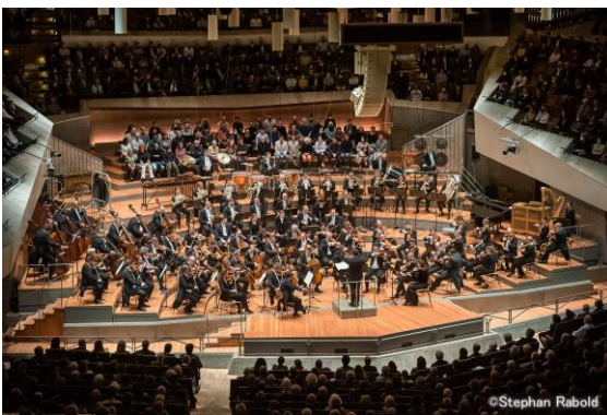
ベルリン・フィルハーモニー管弦楽団

日本での外来オーケストラ公演史に刻まれる今年度最注目の公演を、ぜひ会場でご堪能ください。