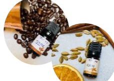
COFFEE &amp; CHAI