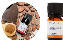
CACAO &amp; オレンジ