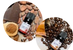
CACAO &amp; COFFEE