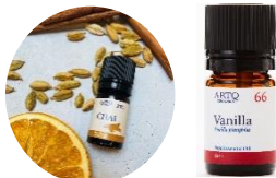
CHAI &amp; バニラ