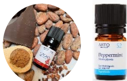
CACAO &amp; ペパーミント