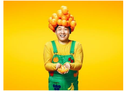
<フルーツおじさんとっしー>