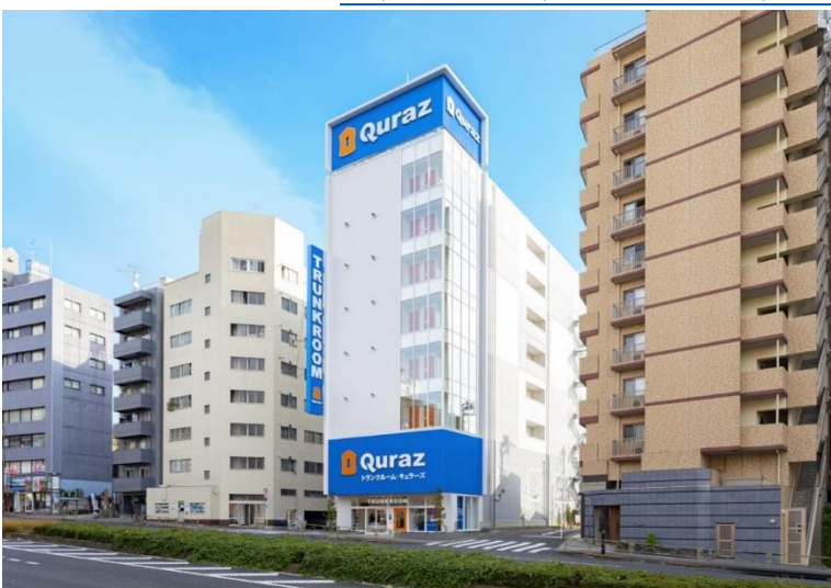
トランクルーム・キュラーズ高輪台店