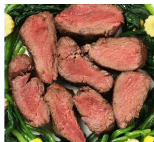
カンガルー サーロイン ブロック 約450g オーストラリア産 3,300円

高たんぱく、低脂肪、低カロリー。さらに、体脂肪燃焼効果と筋肉増強効果が期待される「共役リノール酸」が豊富に含まれます。クセがなく柔らかく、美味しくヘルシーなお肉です。