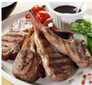
ラムチョップ 5本 ニュージーランド産 WAKANUISプリングラム 2,370円

ラム肉は低カロリーで栄養価が高く、近年人気が高まっています。中でも、脂肪を燃焼させるのに不可欠な「L-カルニチン」を多く含むことで注目されています。