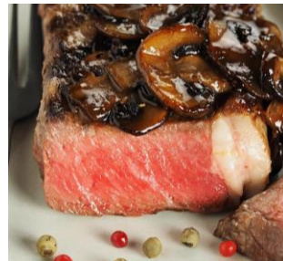
グラスフェッドビーフ サーロインステーキ 270g 1,260円

グラスフェッドビーフ（牧草飼育牛肉）は、穀物飼育牛に比べ高たんぱく・低脂肪。コレステロール値を下げ血液をさらさらする働きが注目される「オメガ3脂肪酸」や、アンチエイジング効果が期待できる「ビタミンE」などの栄養素が含まれています。