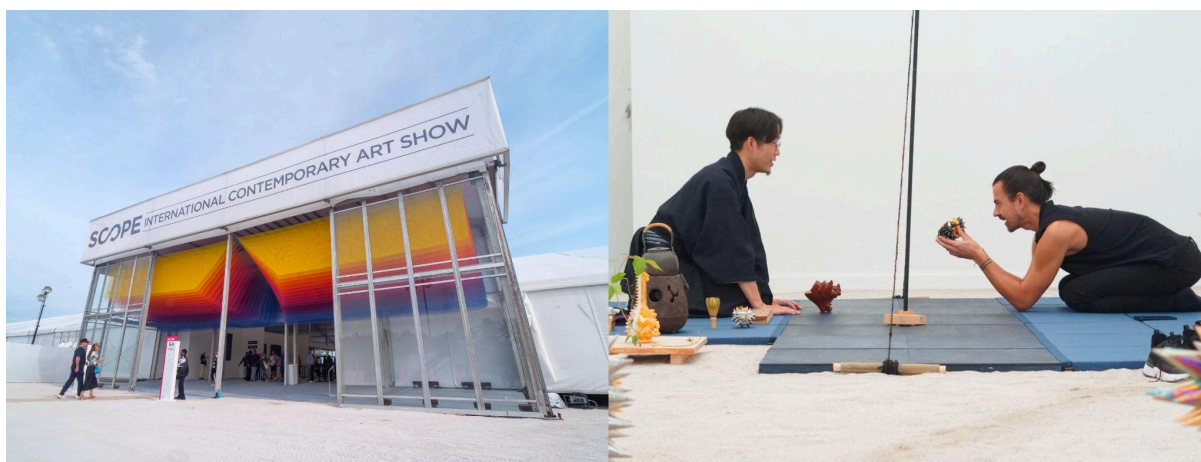
過去開催の「SCOPE MIAMI BEACH 2023」の様子

https://prtimes.jp/main/html/rd/p/000000035.000038444.html