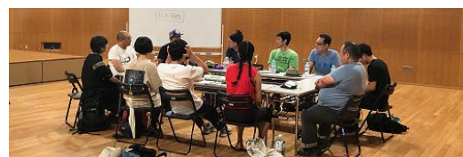
創作ワークショップの様子