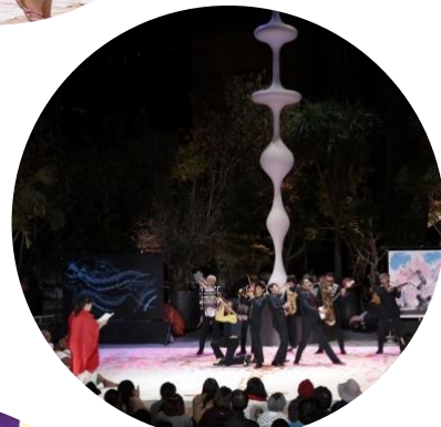
東京キャラバン in 六本木(2016年)