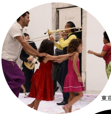
東京キャラバン in RIO(2016年)