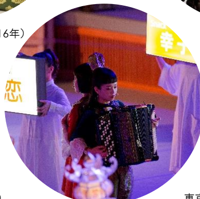
東京キャラバン in 秋田(2018年)