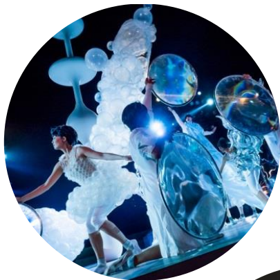
東京キャラバン～プロローグ～(2015年)