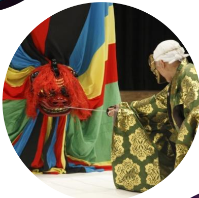
東京キャラバン in 東北(2016年)