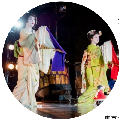
東京キャラバン in 京都(2017年)