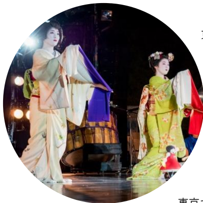
東京キャラバン in 京都(2017年)