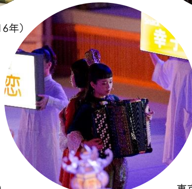
東京キャラバン in 秋田(2018年)