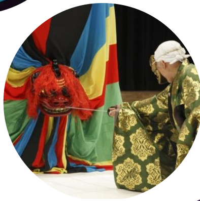
東京キャラバン in 東北(2016年)