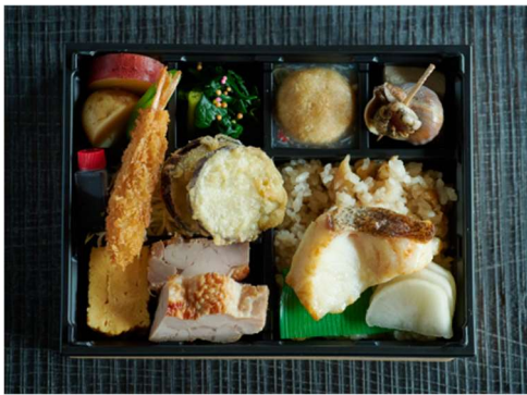
きのえね omoya の会席弁当 1,890円(税込)

「酒と二十四節気料理 きのえね omoya」の味を、ご自宅でのご慶事やご法事にお手軽にご利用いただければ幸甚でございます。