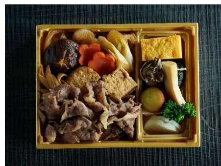
きのえね omoya すき焼き弁当 並：2,106円(税込)