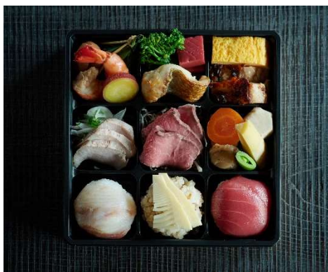
きのえね omoya の彩り弁当 3,726円(税込)