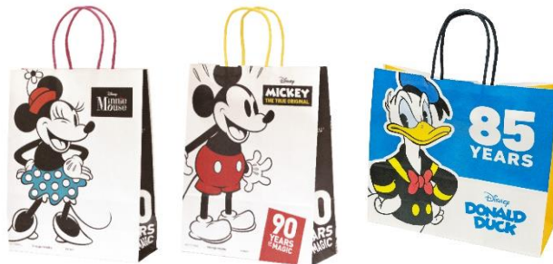
ミニーマウス Ver. ミッキーマウス Ver. ドナルドダック Ver.