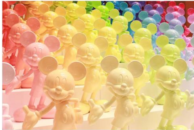
スタチュー(ミッキーマウス、ミニーマウス、ドナルドダック)