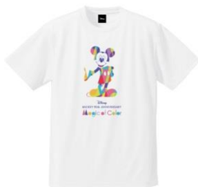
T シャツメインアート