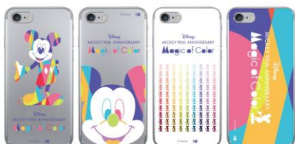
スマートフォンカバー各種