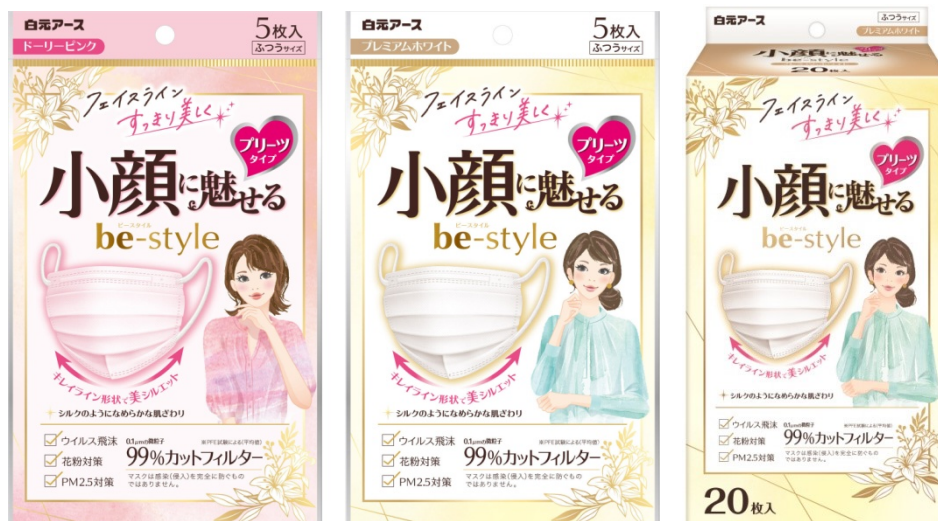
ビースタイル プリーツタイプ ふつうサイズ ドーリーピンク5枚入 / プレミアムホワイト5枚入 / プレミアムホワイト20枚入

※フィルター部捕集性能（平均値） 0.1\mu\text{m} の微粒子（PFE試験）、ウイルス飛沫（VFE試験）、花粉（花粉捕集効率試験）