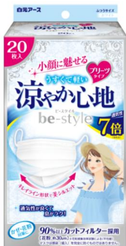
ビースタイル プリーツタイプ 涼やか心地20枚入