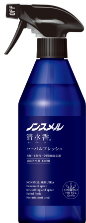
ノンスメル清水香 ハーバルフレッシュの香り 本体400mL