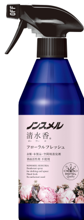
ノンスメル清水香 フローラルフレッシュの香り 本体400mL