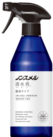
ノンスメル清水香 無香 本体400mL