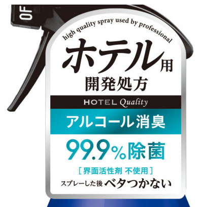
店頭陳列時のPOPシール ※商品共通デザイン