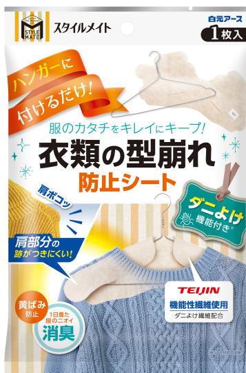
スタイルメイト 衣類の型崩れ防止シート