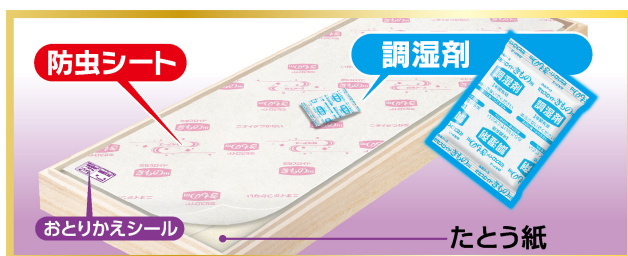
ミセスロイドきもの用