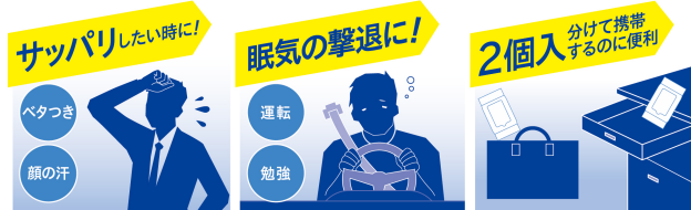
アイスノン 極冷え洗顔シート 20枚×2個入

『アイスノン 極冷え洗顔シート』は、顔の汗やべたつき、アブラが気になった時にサッと取り出していつでもどこでも使えるクールタイプの洗顔シートです。極冷えシートが顔の汗・べたつき・アブラをスッキリふき取り、クール成分（メントール）配合で強力なクール感と爽快感が持続します。また、ふいている最中に丸まりにくく破れにくい、厚手の大判シートで、スッキリとリフレッシュできます。