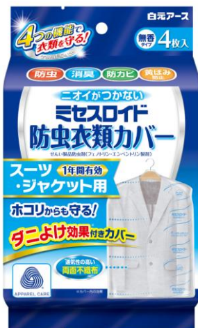
ミセスロイド防虫衣類カバー スーツ・ジャケット用4枚入 1年防虫