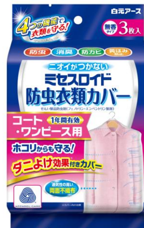
ミセスロイド防虫衣類カバー コート・ワンピース用3枚入 1年防虫