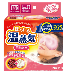
リラックスゆたぼん 目もと用ほぐれる温蒸気