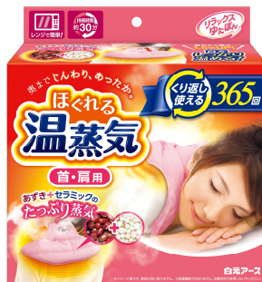
リラックスゆたぼん 首・肩用ほぐれる温蒸気