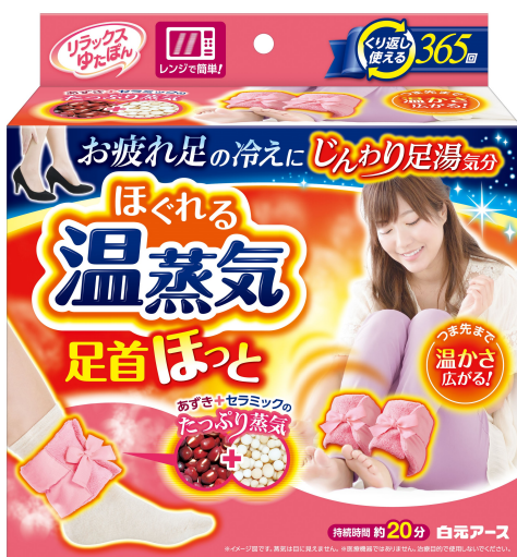
リラックスゆたぽん 足首ほっと ほぐれる温蒸気

白元アース株式会社（本社：東京都 台東区、社長：吉村一人）は、電子レンジで温めてくり返し使える蒸気タイプの保温具『リラックスゆたぽん 足首ほっと ほぐれる温蒸気』を8月23日より新発売いたします。