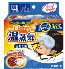
リラックスゆたぼん 目もと用ほぐれる温蒸気 for MEN