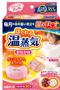
リラックスゆたぼん おなか用ほぐれる温蒸気