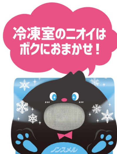
ノンスメル ぱくぱく炭 冷凍室用