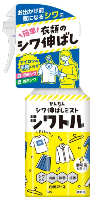
衣類のシワ伸ばしミスト シワトル