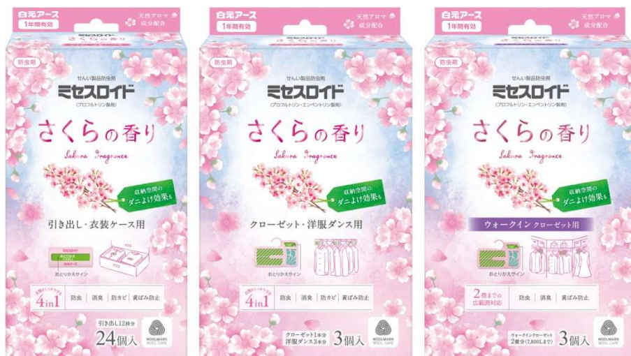
ミセスロイド さくらの香り 引き出し用／クローゼット・洋服ダンス用／ウォークインクローゼット用