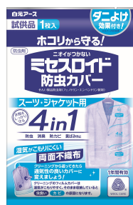
ミセスロイド防虫カバー 試供品

消費者の方のお問い合わせ 白元アース株式会社 お客様相談室 TEL 03-5681-7691 受付時間 9:00~17:00(土、日、祝日を除く) 〒110-0015東京都台東区東上野2-21-14 http://www.hakugen-earth.co.jp/