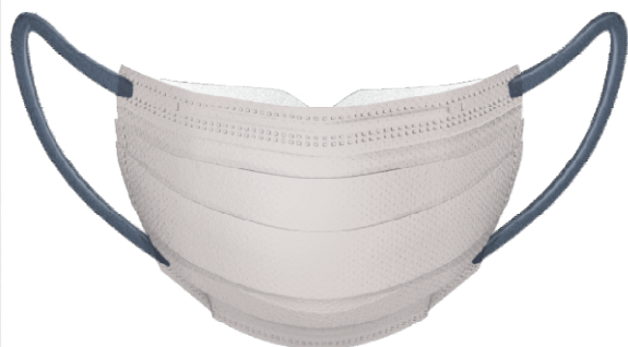
快適ガードプロ プリーツタイプ ふつうサイズ グレースタイル 5枚入