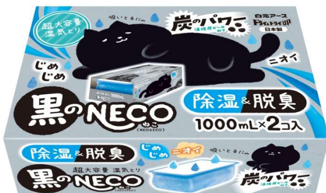
ドライ&ドライUP 黒のNECO 1000mL

白元アースは、環境配慮や新たな付加価値を備えた商品で、市場の活性化を目指してまいります。