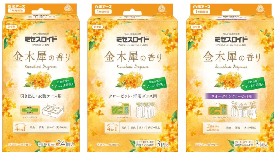
ミセスロイド 金木犀の香り

さらに、より充実した衣類・収納空間ケアを行なっていただきたいという思いから、『ミセスロイド防虫カバー スーツ・ジャケット用試供品1枚』を同梱した限定企画品を発売いたします。同梱する「ミセスロイド防虫カバー」も、衣類を守る4つの機能とカバー内のダニよけ効果*がついた多機能タイプです。※屋内塵性ダニに対する効果