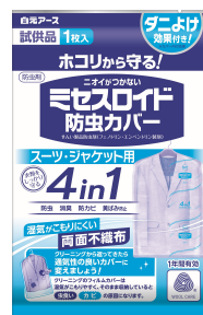
ミセスロイド防虫カバー 試供品

消費者の方のお問い合わせ 白元アース株式会社 お客様相談室 TEL 03-5681-7691 受付時間 9:00~17:00(土、日、祝日を除く) 〒110-0015東京都台東区東上野2-21-14 http://www.hakugen-earth.co.jp/