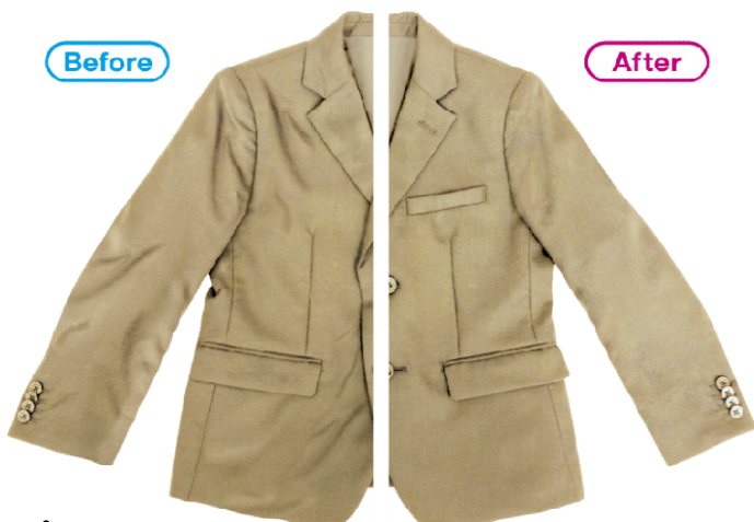
ノンスメル清水香 衣類のしわとりプラス 本体400mL