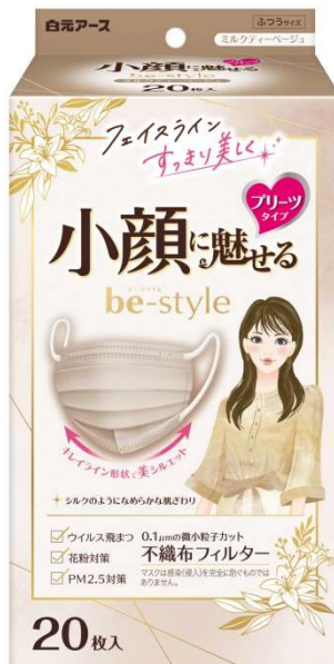
ビースタイル プリーツタイプ ふつうサイズ ミルクティーページュ20枚入