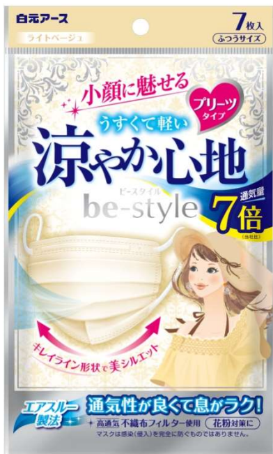
ビースタイル プリーツタイプ 涼やか心地 ライトベージュ 7枚入