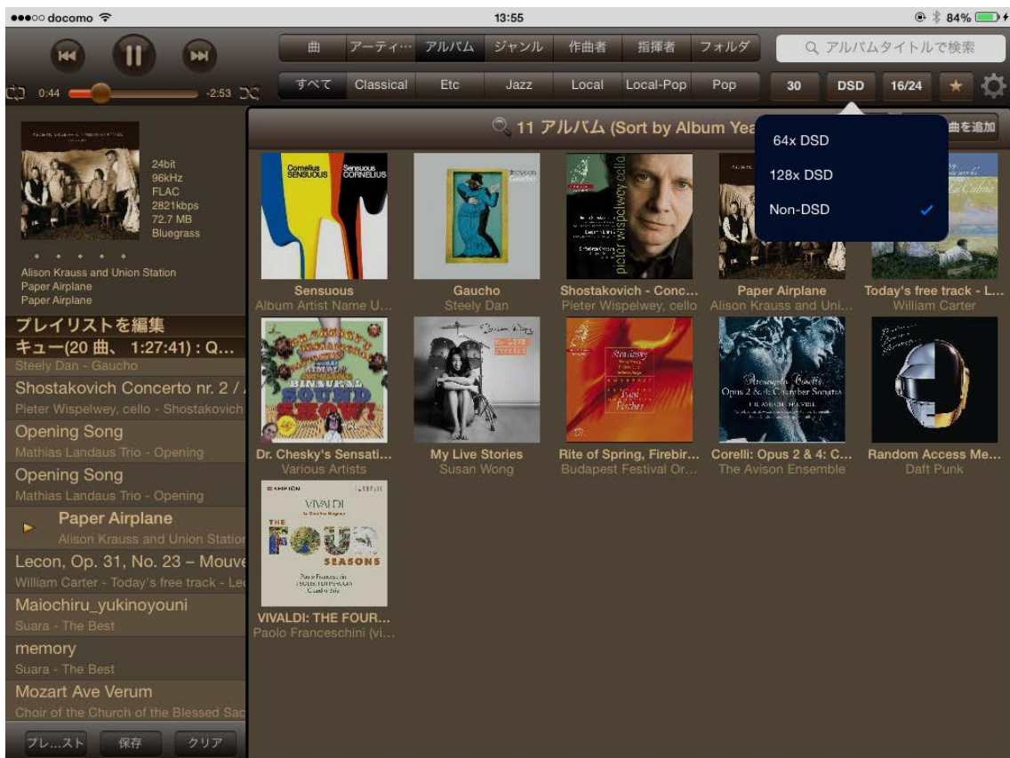
【ご参考】選曲画面（DSD ファイルソート状態）