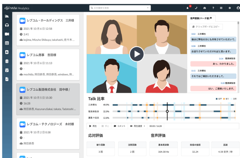
「MiiTel for Zoom（ベータ版）」の画面イメージ