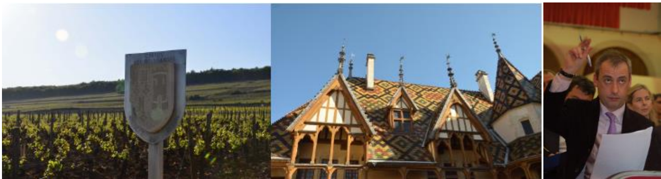
寄付されたぶどう畑

「オスピス・ド・ボーヌ」は、フランス東部のボーヌにある慈善活動を目的とした、施療院(ユネスコ世界遺産認定)の運営のために寄付されたぶどう畑で造られたワインです。ボーヌはブルゴーニュ・ワインの産地として有名で、毎年11月にオスピスで開かれるワインのオークションは国際的に知られています。「オスピス・ド・ボーヌ」は毎年9月に収穫・醸造され、11月にオークションで樽のまま売買され、売上金は慈善団体への寄付や施療院の運営費に充てられています。このワインは、通常ワイン商(ネゴシアン)を通して18カ月の間にワイン貯蔵庫(カーブ)で樽熟成後、ボトリング・出荷されます。1樽はボトルでおよそ288本相当であることから、これまで個人のお客様による購入は困難でしたが、いよいよ日本にいながら1本からオークションに参加し、購入できるようになります。Home & Kitchen( https://home-kitchen.jp/ )は、日本国内の個人のお客様が購入できるよう、オークションへの参加・購入をお手伝いいたします。