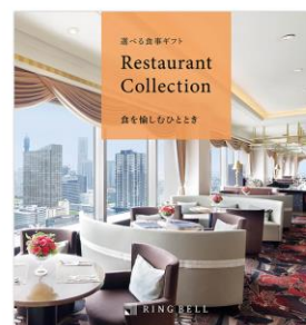
グルメギフト券 (1万円相当)