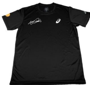
リーチマイケル選手 サイン入り トレーニングウェア