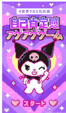
「自己肯定感アゲアゲゲーム」

10月4日(金)より、スマートフォン上で無料で遊べる「#世界クロミ化計画」にちなんだゲームを公開いたします。今回公開したのは、自己肯定感が“サゲサゲ”になってしまった人たちに、クロミのカチューシャをスワイプして届ける「自己肯定感アゲアゲゲーム」です。10月11日(金)からは、クロミが「自分に自信が持てない」と落ち込む人たちの背中を物理的に押しまくるゲーム「アンタの背中全力で押してやるよ! byクロミ」も公開いたします。