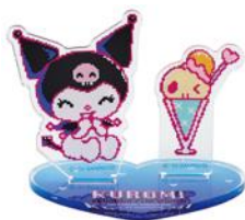
アクリルスタンド 1,100円