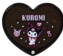
ハート型コンパクトミラー 1,650円