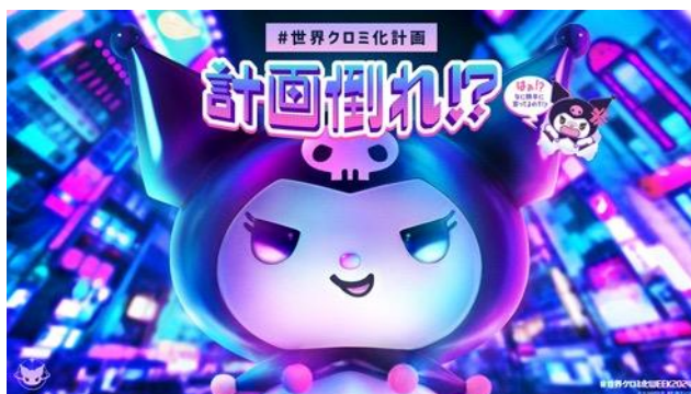
「#世界クロミ化WEEK2024」キービジュアル

10月4日(金)より、JR新宿駅東口の大型街頭ビジョン「クロス新宿ビジョン」でクロミ初の3D動画を放映するほか、10月5日(土)には新宿周辺で「#世界クロミ化計画」特別号外を配布します。また、スマートフォン上で無料で遊べる「#世界クロミ化計画」にちなんだゲーム2タイトルを順次公開し、ゲームに登場するピクセルアート風のイラストを使用したグッズを一部サンリオショップとキデイランドで発売いたします。他にも、東京・新宿と大阪・天王寺のサンリオショップの一部コーナーが期間限定で“クロミ化”し、「#世界クロミ化WEEK2024」特別装飾になったり、10月9日(水)からは全国の回転すし「スシロー」とのコラボ「#スシロークロミ化計画」がスタート。クロミが「#世界クロミ化計画」を続行しようと奮闘する「#世界クロミ化WEEK2024」をぜひお楽しみください。