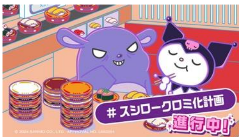
「#世界クロミ化WEEK2024」連動オリジナル動画