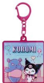
レイヤーアクリルキーホルダー 858円