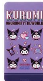
リチウムイオンポリマー充電器 4,708円