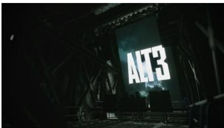
開催フロア B5 ALT3 Directed by 0b4k3