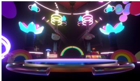
開催フロア B4 FUSION STAGEイメージ

バーチャルクリエイターパフォーマンスでは、個性豊かなクリエイターたちが、従来の枠にとらわれない自由なパフォーマンスを行います。空間を舞うパーティクルを生かした演出や、ゲーム性の高いインタラクティブな演出、サンリオキャラクターとのコラボレーションなど、バーチャル空間を最大限に生かしたパフォーマンスを体験できます。