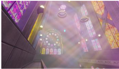
開催フロア B3 LUMINA STAGEイメージ

バーチャルアーティストパフォーマンスでは、多様なバーチャルアーティストが出演。サンリオキャラクターが刻まれたステンドグラスがアーティストのパフォーマンスを鮮やかに彩り、光と音の演出で訪れた方々の心を魅了します。