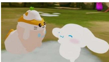
バーチャルグリーティングイメージ