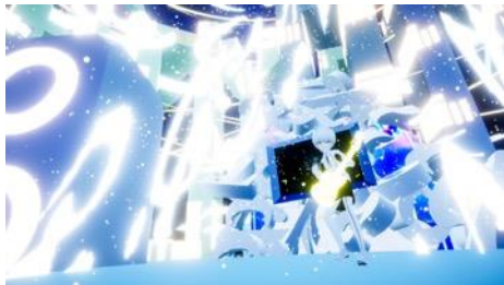
過去開催の様子(キユ)