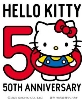
ハローキティ50周年ロゴマーク

株式会社サンリオ(本社：東京都品川区 代表取締役社長：辻 朋邦、以下サンリオ)の人気キャラクター「ハローキティ」は、2024年に50周年を迎えます。2023年11月1日から2024年12月31日までの期間を「50周年アニバーサリーイヤー」として、「Friend the Future. 未来と友だちになろう。」をテーマに様々な取り組みを行う予定です。また、サンリオピューロランド(東京都多摩市)とハーモニーランド(大分県日出町)でもアニバーサリーイベントを開催します。開催時期や内容の詳細は今後公式ホームページなどで順次お知らせいたします。ハローキティ50周年という特別な1年に、ぜひご注目ください。