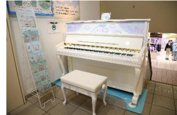
ラフォーレ原宿内にはシナモンデザインの アップライトピアノも登場