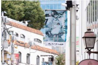
原宿竹下通り内に掲出しているフラッグ