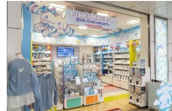
原宿竹下通り内にある「sanrio vivitix HARAJUKU」も イベント期間中はシナモンショップに変身