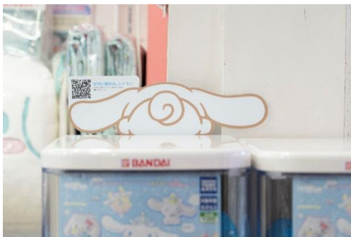
原宿竹下通り内にも好きなファッションで自由に隠れるシナモンがいくつも見られます （「好きに隠れる。シナモン」）