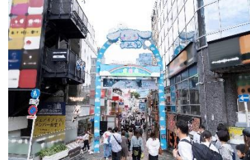
JR 原宿駅側の原宿竹下通り入り口に 大きなバルーンが登場