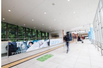
JR 原宿駅改札内にも 「好きを着る。ファッションウィーク」開催を記念し シナモン装飾が登場