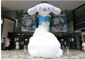
1F 入り口にはモニュメントが登場