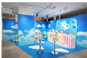
2F ネイルプリント体験ができるそらルーム