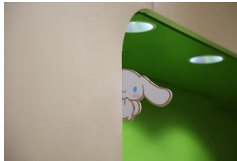
ラフォーレ原宿館内にも、自由に隠れるシナモン （「好きに隠れる。シナモン」）