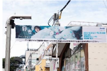
原宿竹下通り内に掲出しているポスター