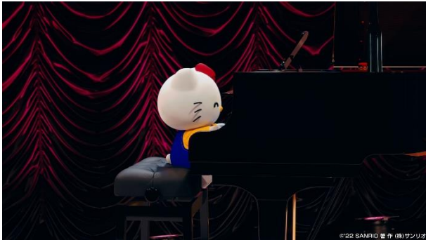
間奏ではキティのピアノソロも！