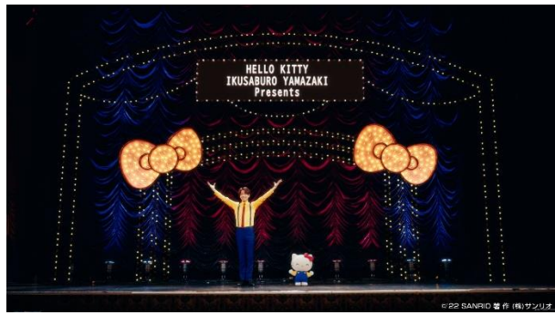
ミュージカルシアターの舞台に二人が登場