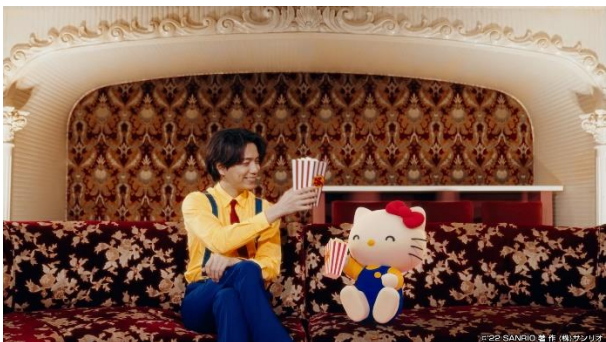
ポップコーンを仲良く食べる二人