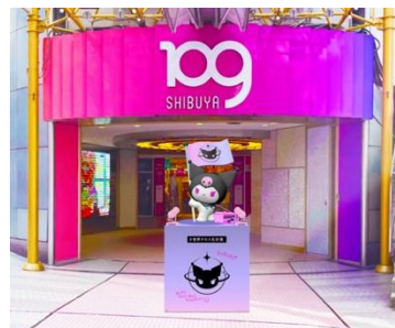
SHIBUYA109 店頭イベントスペースに登場するクロミのオブジェ（画像はイメージ）

ポスター掲出、SHIBUYA109 店頭イベントスペースにオブジェが登場するほか、「#世界クロミ化計画」の始動をアピールするべく、SHIBUYA109 渋谷店で様々な展開を予定しています。詳細は後日公開予定。様々な取り組みを通して、クロミが発信したい想いを表現し伝えていきます。今後の展開にもご期待ください。