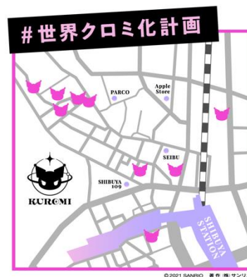
ポスター掲出場所は、クロミマークが目印