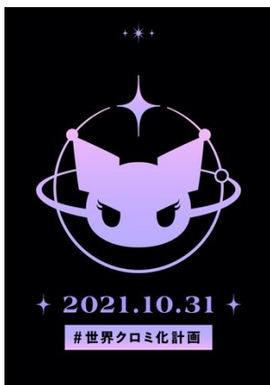
渋谷掲出中のポスター（メインビジュアルバージョン）

10月26日(火)～11月8日(月)の期間中、「#世界クロミ化計画」を告知するポスターを渋谷の街の各所に掲出しています。メインビジュアルのポスターを掲出するほか、数枚のみクロミのシルエットデザインやサインが描かれた特別バージョンも登場しています。複数のポスターで「#世界クロミ化計画」をアピールしています。