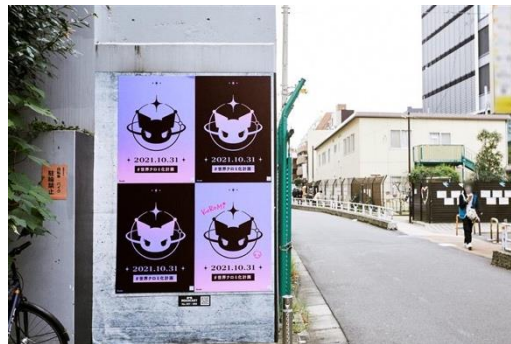
26日より渋谷の街にポスター掲出中