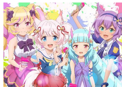
Mashumairesh!! (SHOW BY ROCK!!)

©'21 SANRIO SP-M ©AKB48 ©Kizuna AI ©BANDAI NAMCO Arts Inc. ©ANYCOLOR, Inc. Art by KEI ©Crypton Future Media, INC.