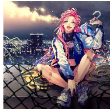
CHiCO with HoneyWorks