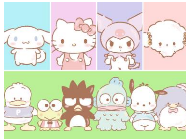
ハローキティ、シナモロール、クロミ、 こぎみゆん、はぴだんぶい