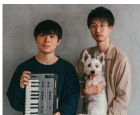
パソコン音楽クラブ