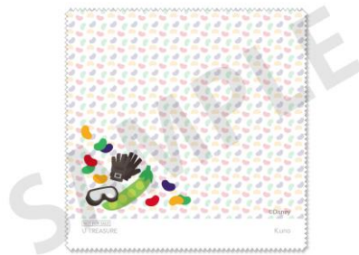
【特典】ジュエリークロス