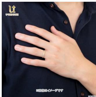
プラチナ 950×K18 イエローゴールド 着用イメージ