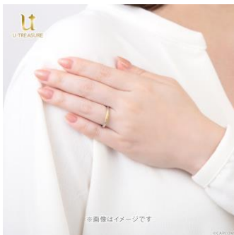
プラチナ 950×K18 イエローゴールド 着用イメージ