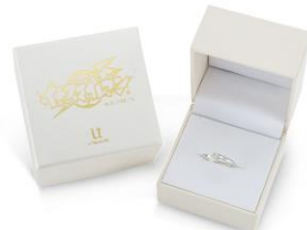
ロゴ入りのボックスに入れてお届けします