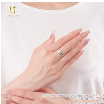
重ね着け 着用イメージ