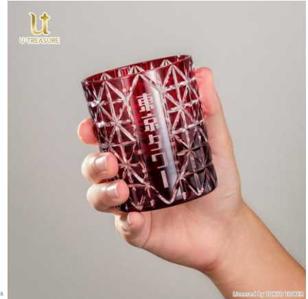
Mezarcop TOKYO TOWER