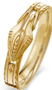
K18 イエローゴールド