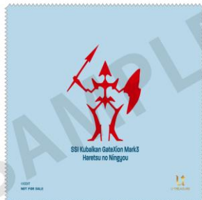
【特典】マイクロファイバークロス