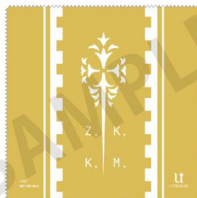
【特典】マイクローファイバークロス