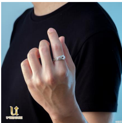
シルバー（着用イメージ）