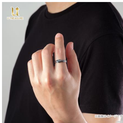
シルバー（着用イメージ）