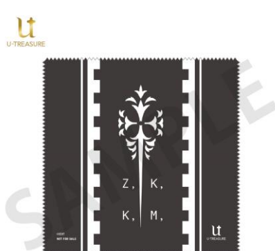
【特典】マイクロファイバークロス