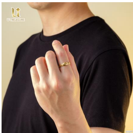
シルバー（着用イメージ）