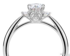
石座にクライシス・ムーン・コンパクトをデザイン