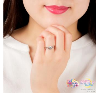
Crisis Moon Compact Ring と Moonlight Ring Eternal ver. レディースの重ね付けイメージ