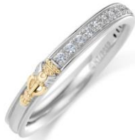
Moon Kaleidoscope Half Eternity Ring