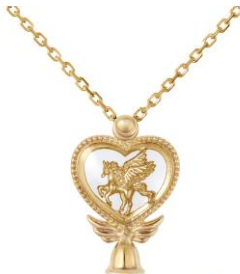
K18 イエローゴールド