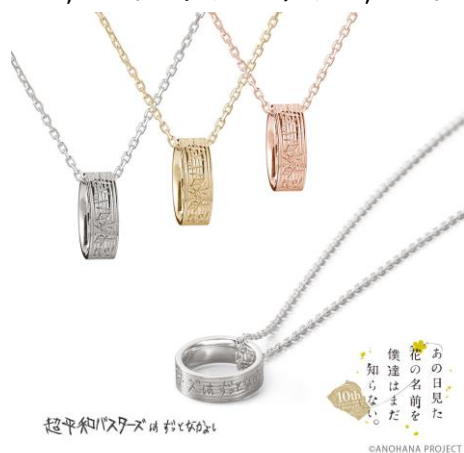
作中のグラフィックを表現して指輪の表面にデザイン

【あの日見た花の名前を僕達はまだ知らない。】超平和バスターズ リングネックレス 「あの花」10周年記念商品。いつまでも色褪せない想いをネックレスに…。ユニセックスで楽しめるサイズ感のリングネックレス。表面は木目調のテクスチャーを施し、「超平和バスターズはずっとなかよし」の文字を刻んでいます。 税込価格・素材：15,400円（シルバー）、41,800円（K10イエローゴールド/K10ピンクゴールド）