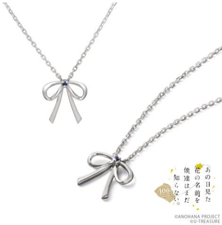
めんまのリボン ネックレス

税込価格・素材：13,200円（シルバー）、35,200円（K10ホワイトゴールド）