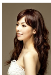
森麻季(ソプラノ) ヴィオレッタ