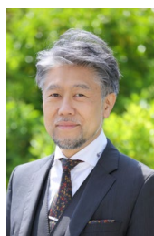
小森輝彦(バリトン) ジェルモン