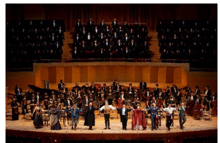
(第34回 成人の日コンサート 2023の様子)