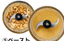
⑤ペースト ピーナッツバター