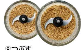
⑨つぶす すりごま、離乳食