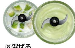
⑧混ぜる スムージー、ドレッシング