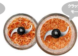
③砕く 乾物、ふりかけ