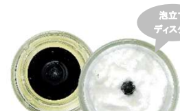
⑫泡立て メレンゲ、生クリーム

便利なスパチュラ、普段の食材で作る24レシピ掲載のレシピブック、すっきりおさまる収納ポーチも付属