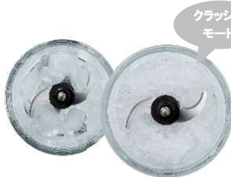
①クラッシュアイス 氷、かき氷