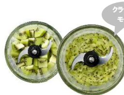
②練る アイスデザート